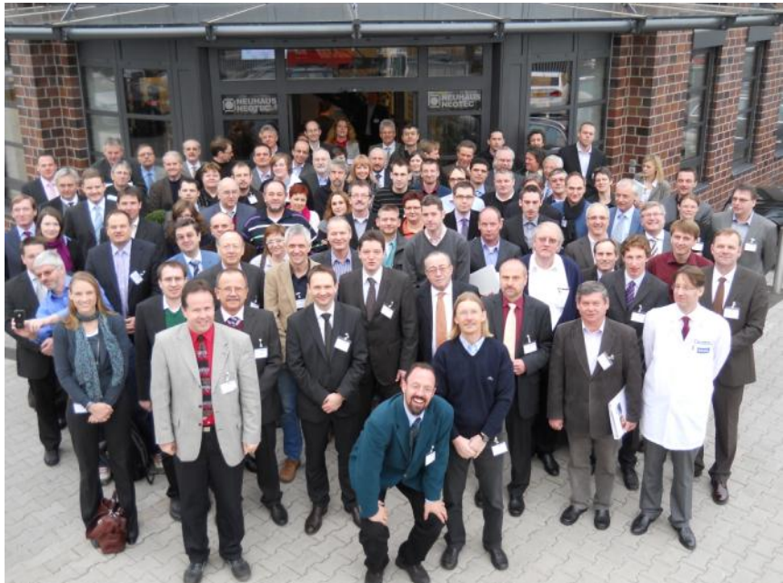
Rund 140 internationale Gäste nahmen am Fachsymposium am 17. und 18.02. zur Eröffnung unseres neuen Technikums in Ganderkesee teil.

Am 17. und 18. Februar 2011 war es soweit: Das neue Technikum am Unternehmensstandort in Ganderkesee wurde im Rahmen eines internationalen Fachsymposiums zur Wirbelschichttechnik feierlich eröffnet. 140 internationale Gäste und die Mitarbeiter von Neuhaus Neotec erlebten zwei informative Tage rund um das Schwerpunktthema „Wirbelschicht-Technologie“. Denn dieser Technologiezweig bildet das Herzstück des Neubaus, in dem neben Büros und Konferenzräumen vor