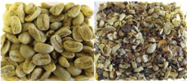
Rohkaffee, ganze Bohne (li.) und Rohkaffeebruch (re.)

Neuhaus Neotec bietet auf ihren neu konzipierten Röstanlagen der Serie RG und RFB die Möglichkeit, Kaffeebruch in gleichmäßiger und hoher Qualität zu rösten. Diese Neuerung wurde von zahlreichen führenden Röstern mit großem Interesse aufgenommen.