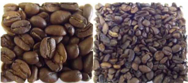
Röstkaffee, ganze Bohne (li) und Kaffeebruch, geröstet auf einem RFB-Röster (re.)

Neuhaus Neotec unterstreicht hiermit einmal mehr die einzigartige Flexibilität des RFB-Systems, welches weltweit für Speciality Coffee, Slow Roast, aber auch schwierig zu röstende Kaffees bis hin zum Kaffeebruch eingesetzt wird.